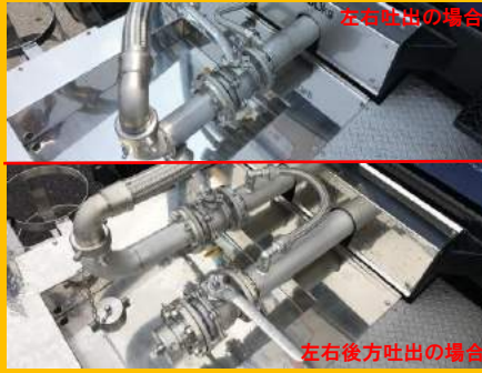
コンテナホース接続.....