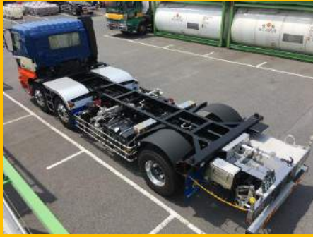
シャーシ(コンテナ取外時).....